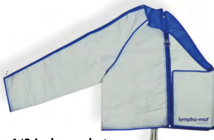
1/2 jackmanchet met 12 luchtkamers rechts met bolereo art. nr. 1182

De manchet wordt tijdens een compressiecyclus achtereenvolgens in 12 fasen met lucht gevuld. Daarbij wordt een dalende drukgradiënt gerealiseerd. Dit zorgt ervoor dat de gemobiliseerde vloeistof ongehinderd kan wegstromen zonder terugstroming.