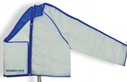
1/2 jackmanchet met 12 luchtkamers links met bolereo art. nr. 1181